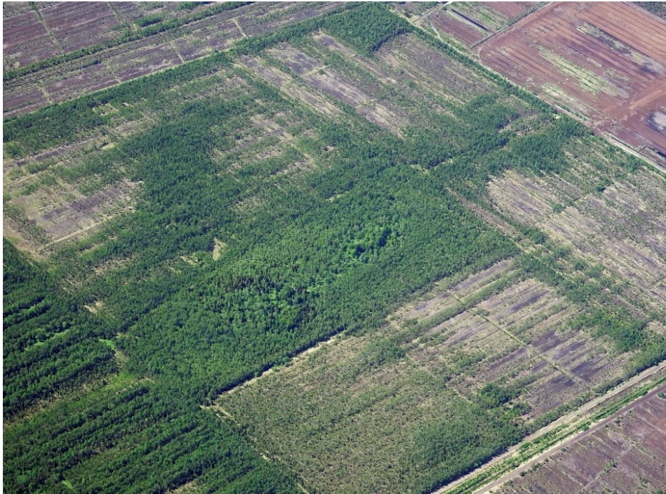
„Vaade Ämmamäe loodusalale” Maa-ameti kaldaerofoto 2019