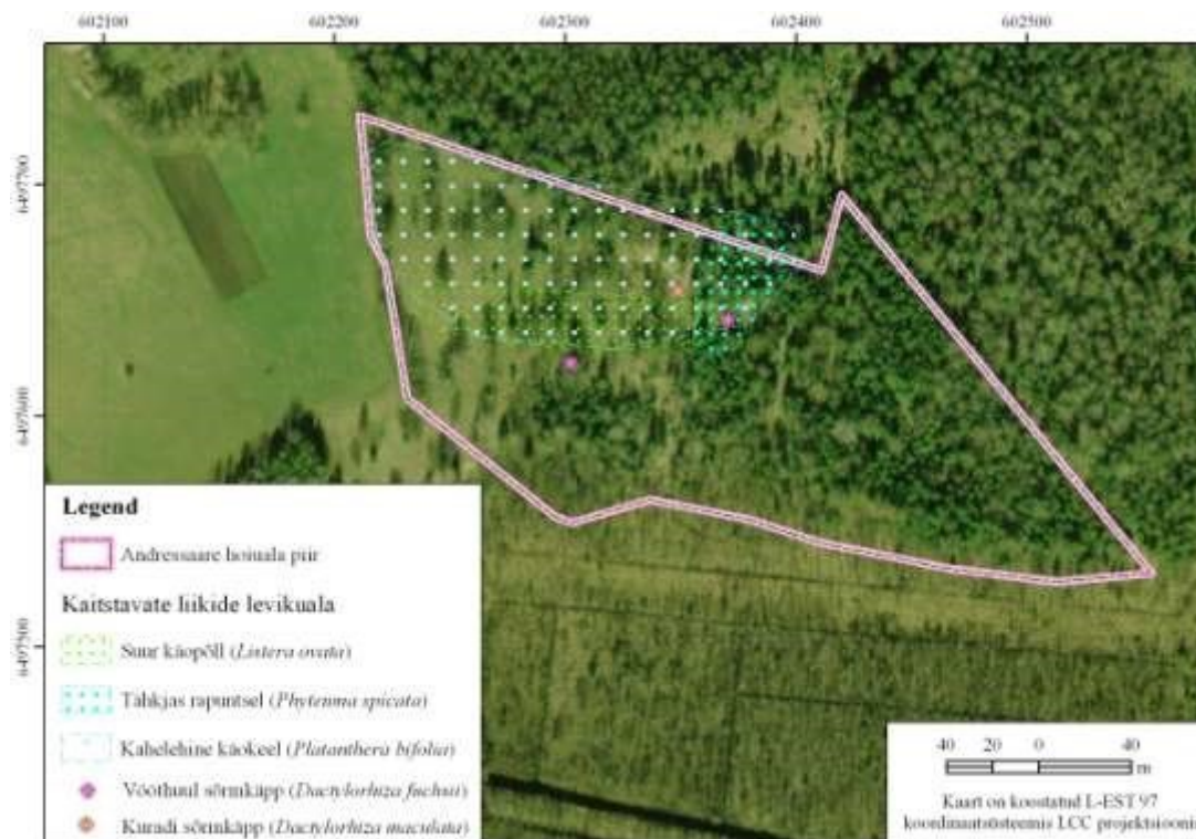
Joonis 5. Kaitstavate taimeliikide levikuala Andressaare hoiualal (Aluskaart: Maa-amet)