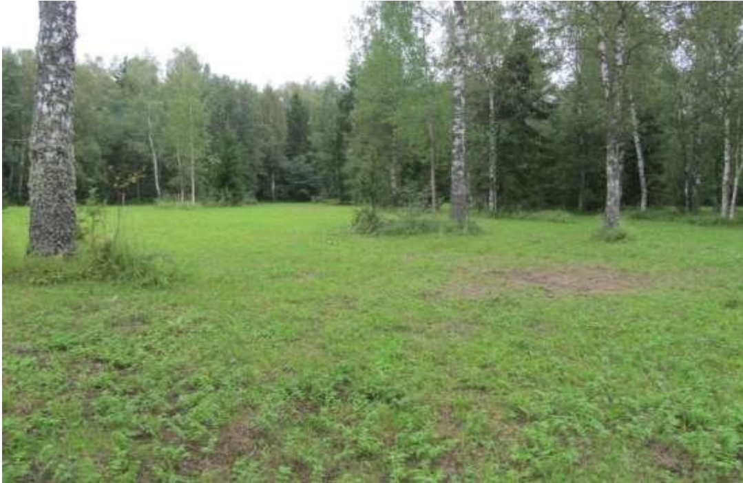
Foto 1. Andressaare niidetud puisniit, 12.08.2012.

ala on varasemalt olnud suhteliselt lage. Hoiuala lõunaosa on liigniiske. Hoiuala puisniidul kasvavad puud on erineva vanusega, esineb ka jalalsurnud puid; lamapuit puudub. Puisniidu hooldatud osas on puude ja põõsagruppide katvus umbes 20%, puurinde struktuur on varieeruv.