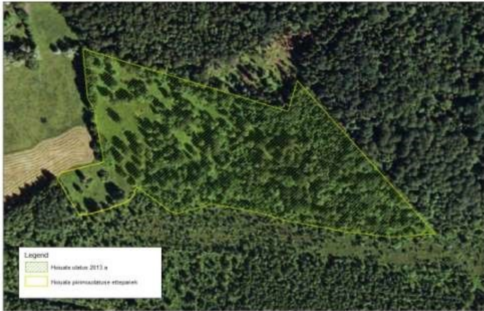
Joonis 3. Ettepanek hoiuala piiri muutmiseks (Aluskaart: Maa-amet)