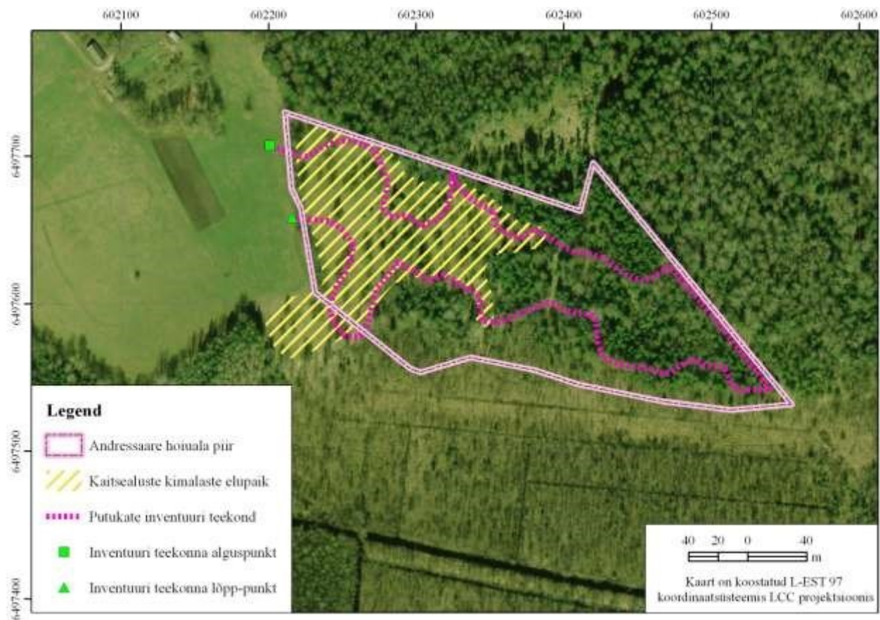
Joonis 4. Kaitsealuste kimalaste elupaigad ja 2012.a inventuuri transekt (Aluskaart: Maa-amet)

Andressaare hoiuala õistaimederohke (liiginimestik on esitatud lisas 4) niiduala olulisimad toidutaimed liblikatele ja kimalastele on harilik angervaks ( Filipendula ulmaria ), harilik härghein ( Melampyrum nemorosum ), harilik äiatar ( Knautia arvensis ), arujumikas ( Centaurea jacea ), narmasjumikas ( Centaurea phrygia ), peetrileht ( Succisa pratensis ) ja ohakad ( Cirsium sp. ). Kimalastele sobivad enim regulaarselt hooldatud puisniidu alad, mis on esitatud joonisel 4.