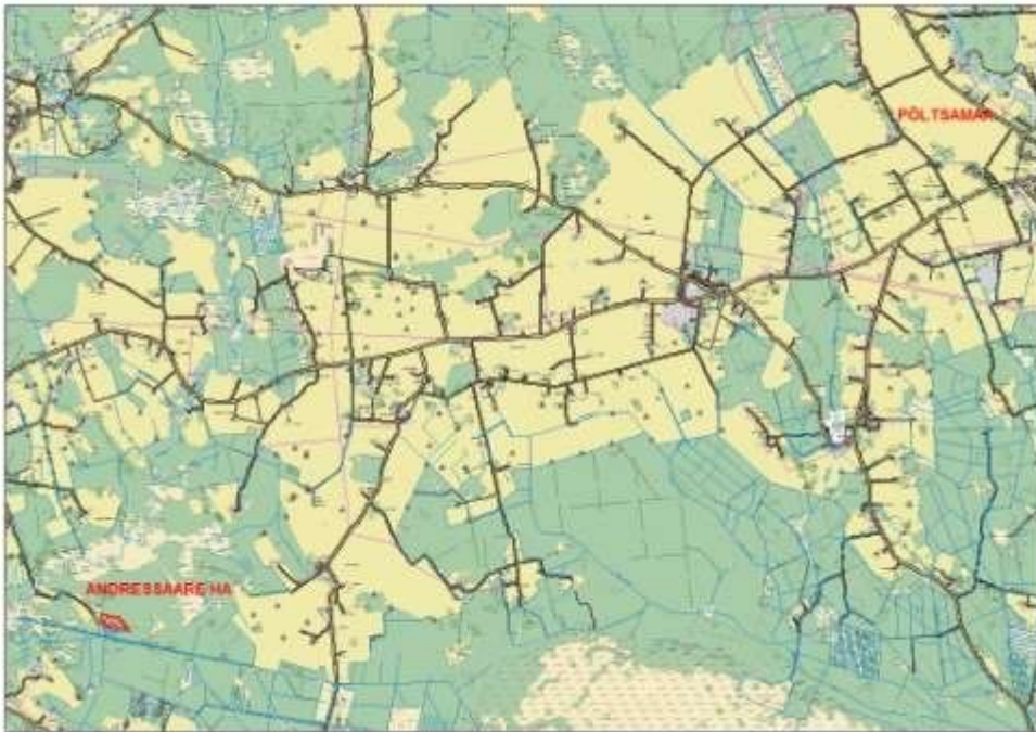
Joonis 1. Andressaare hoiuala asukoht (Aluskaart: Maa-amet)

Andressaare hoiuala iseloomustab väike (1,2 ha) hooldatud puisniit, mille äärealad on võsastumas ning rohttaimede liigirikkus on tagasihoidlik. Kuid arvestades, et Jõgevamaal on ajalooliselt olnud väga vähe puisniite, on oluline selle alleshoidmine. Ka on säilinud niiduala oluline elupaik tolmeldajatele, sh kaitsealustele kimalaseliikidele. Hoiuala põhjapiiril on ca 50 m pikkune madal maakividest osaliselt võsakasvanud aed, mis maastikuelemendina väärib võsast puhastamist.