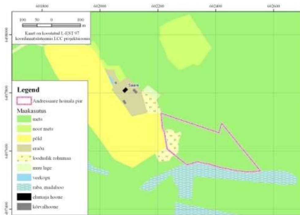
Joonis 2. Hoiuala kõlvikuline jaotus (Aluskaart: Maa-amet)