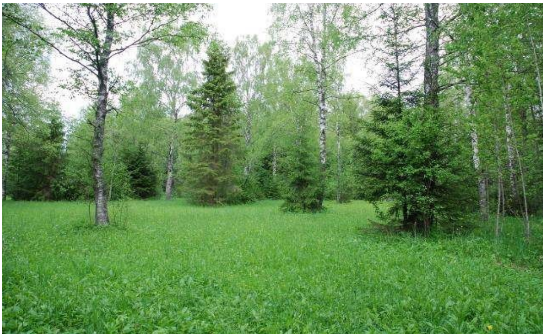
Foto 2. Andressaare puisniit, 03.06.2012. Taustal – puisniidu kinnikasvanud osa.