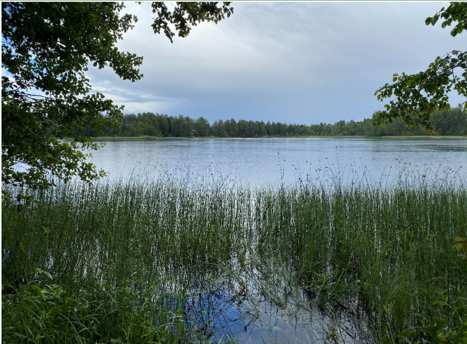
„Vaade Kiruvere järvele” Anna Krete Kangur.