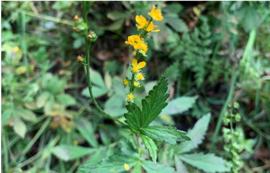
„Karvane maarjalepp ( Agrimonia pilosa )“ Kalev Sepp