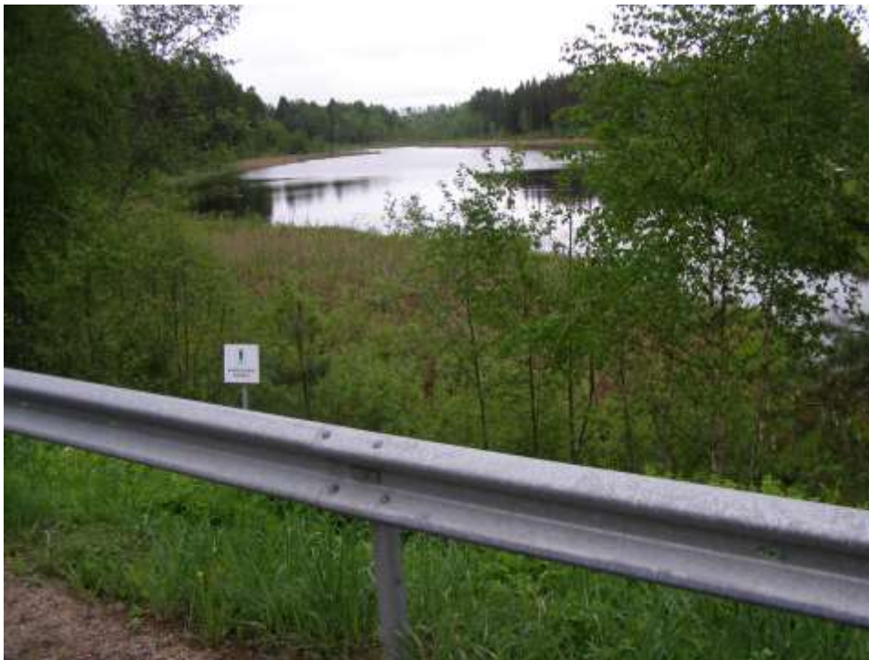
2. Hoiuala tähis Andresjärve läänekaldal maantee ääres (22.05.2013).