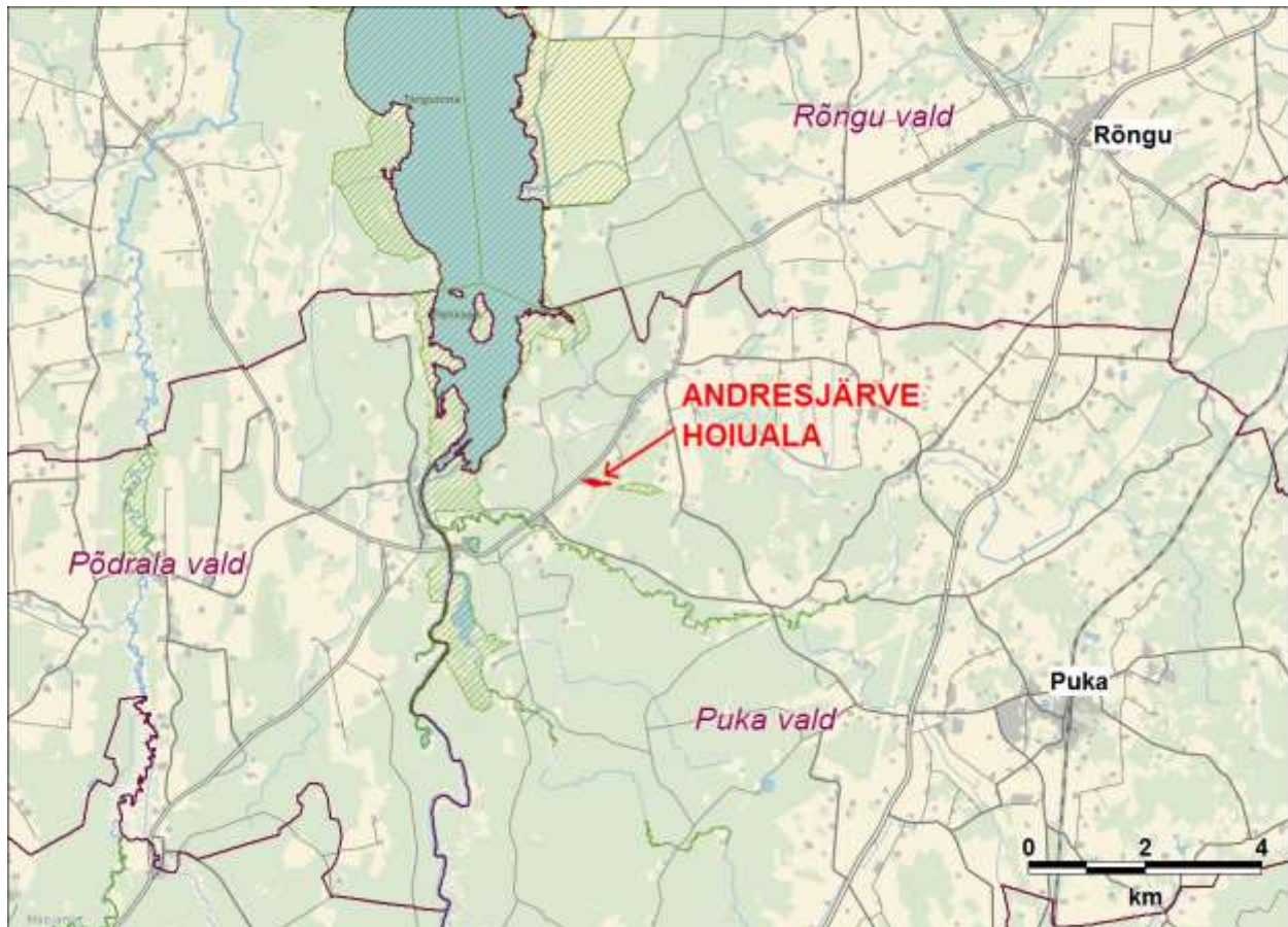
Joonis 1. Andresjärve hoiuala paiknemine (aluskaart: Eesti Baaskaart, Maa-ameti WMS-rakendus, 2013).

Andresjärve külastatavus ja puhke-eesmärgil kasutamine on vähene, kuna seda soodustavad rajatised puuduvad. Järvel on mõningane harrastuskalanduslik tähtsus.