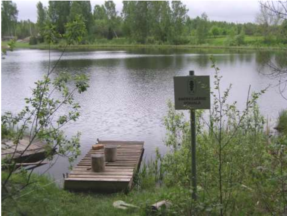
1. Vaade Andresjärve põhjakaldalt, kuhu viib rada läbi riigimetsa (22.05.2013).